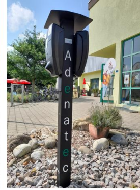
Öffentliche Ladestation, Aesch