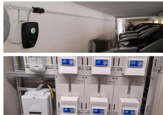
Ladestationen und ZEV, St. Erhard