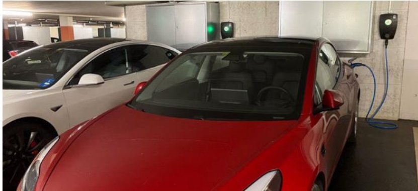
Einstellhalle Ebikon, 150 Parkplätze